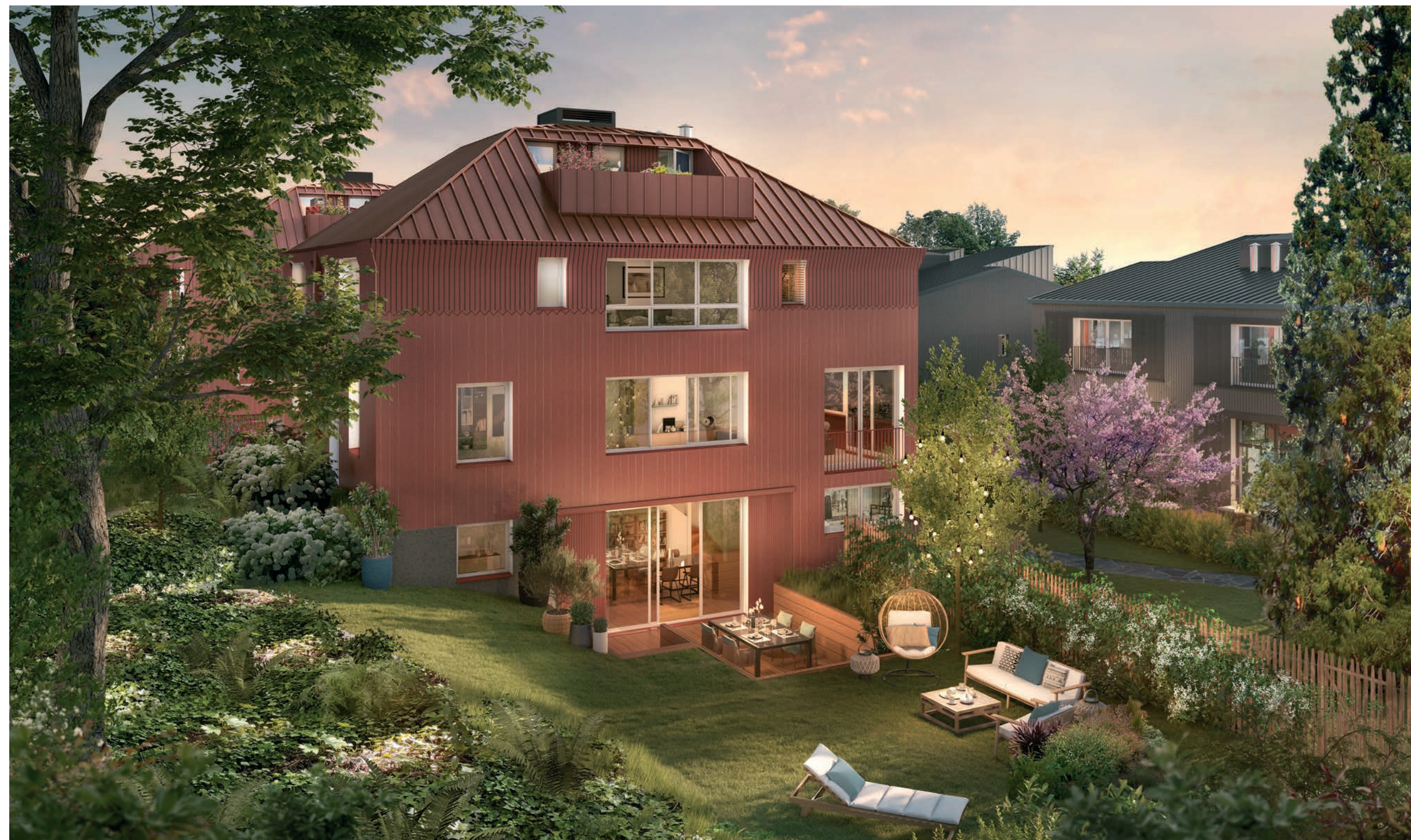
Vue d'une villa jumelle depuis le jardin. Illustration non contractuelle à caractère d'ambiance

Au nord près du boulevard Desgranges, s'élèvent 2 ensembles comprenant chacun 2 villas, se fondant subtilement au cœur du parc arboré. Marquées par une architecture plus horizontale, elles disposent également de façades naturelles en bois brûlé, faisant écho aux villas voisines. Leur signature esthétique, soulignée par des lucarnes aménageables en espaces d'ateliers, illustre la modernité du projet.