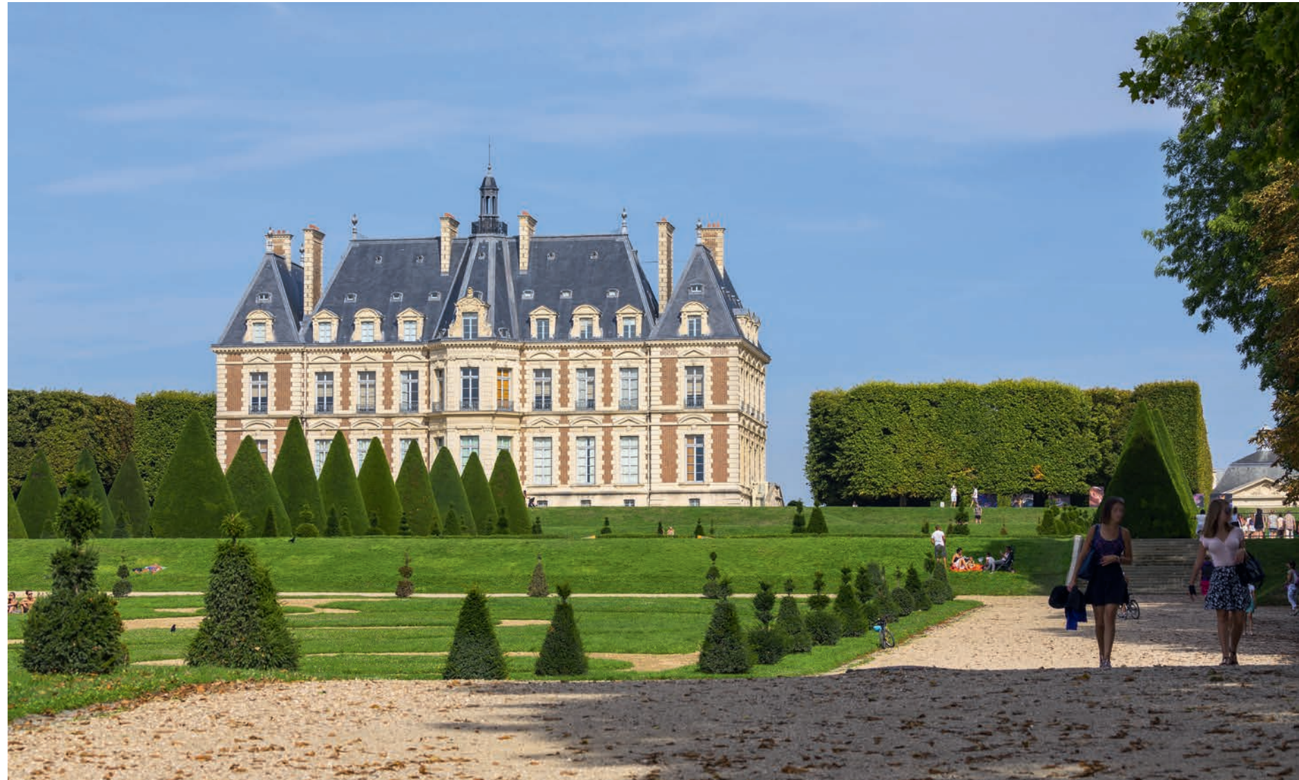
Parc de Sceaux

Bénéficiant d'un patrimoine historique prestigieux dont témoigne son célèbre domaine, Sceaux offre un cadre de vie rempli de quiétude, sublimé par une nature omniprésente. Site iconique de la ville, le Domaine de Sceaux dévoile un paysage à la fois verdoyant et inspirant, dont l'illustre jardin à la française fût dessiné par André Le Nôtre. Aujourd'hui grand parc urbain, il est un véritable lieu où se détendre, jouer, faire du sport et flâner.