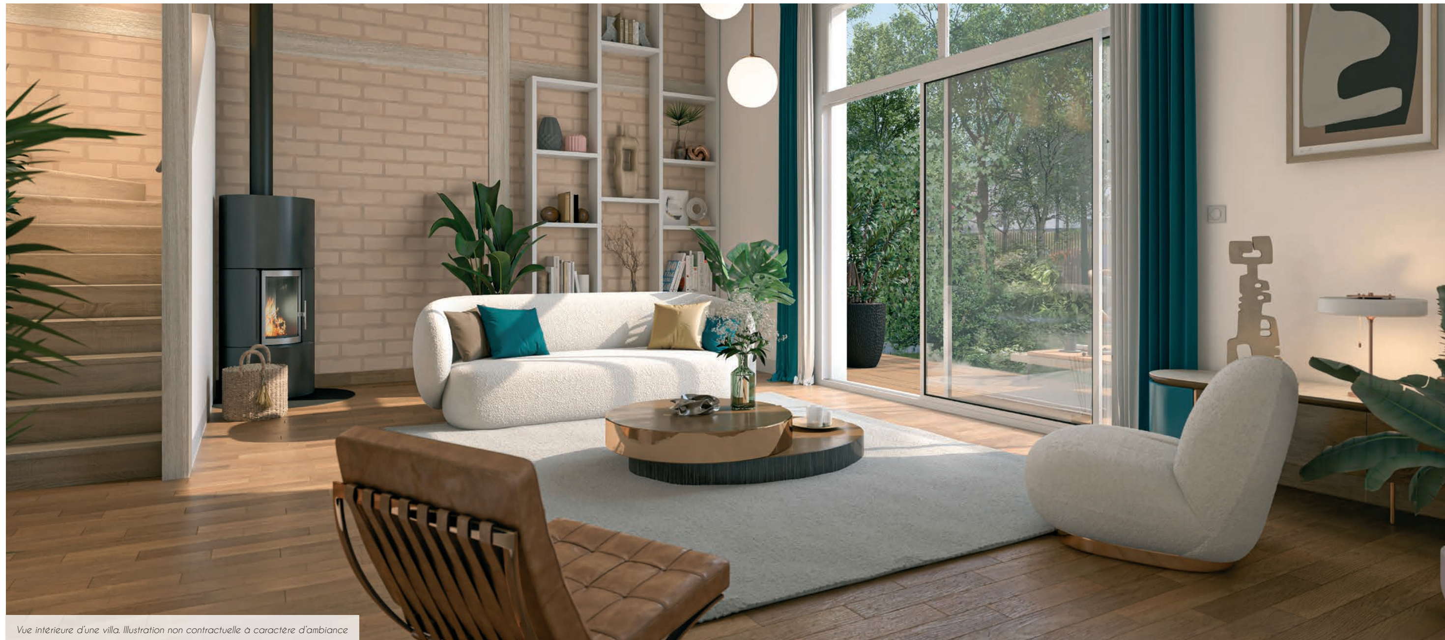
Vue intérieure d'une villa. Illustration non contractuelle à caractère d'ambiance