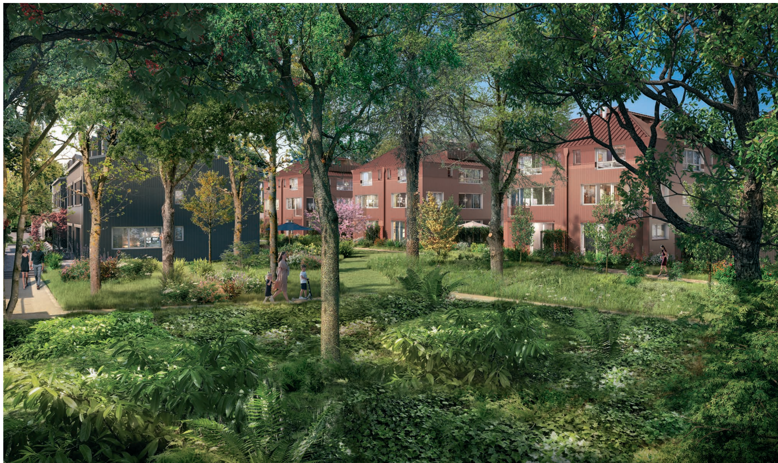
Vue du Clos Baltard depuis le cœur d'îlot paysager. Illustration non contractuelle à caractère d'ambiance