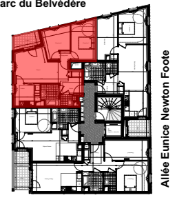
Allée Eumice Newton Foote