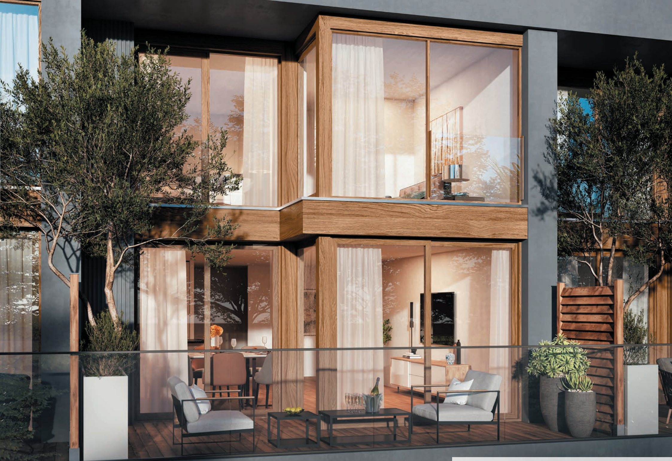
Vue depuis une terrasse d'un duplex de la résidence «Les Ciel de Saint-Cloud»