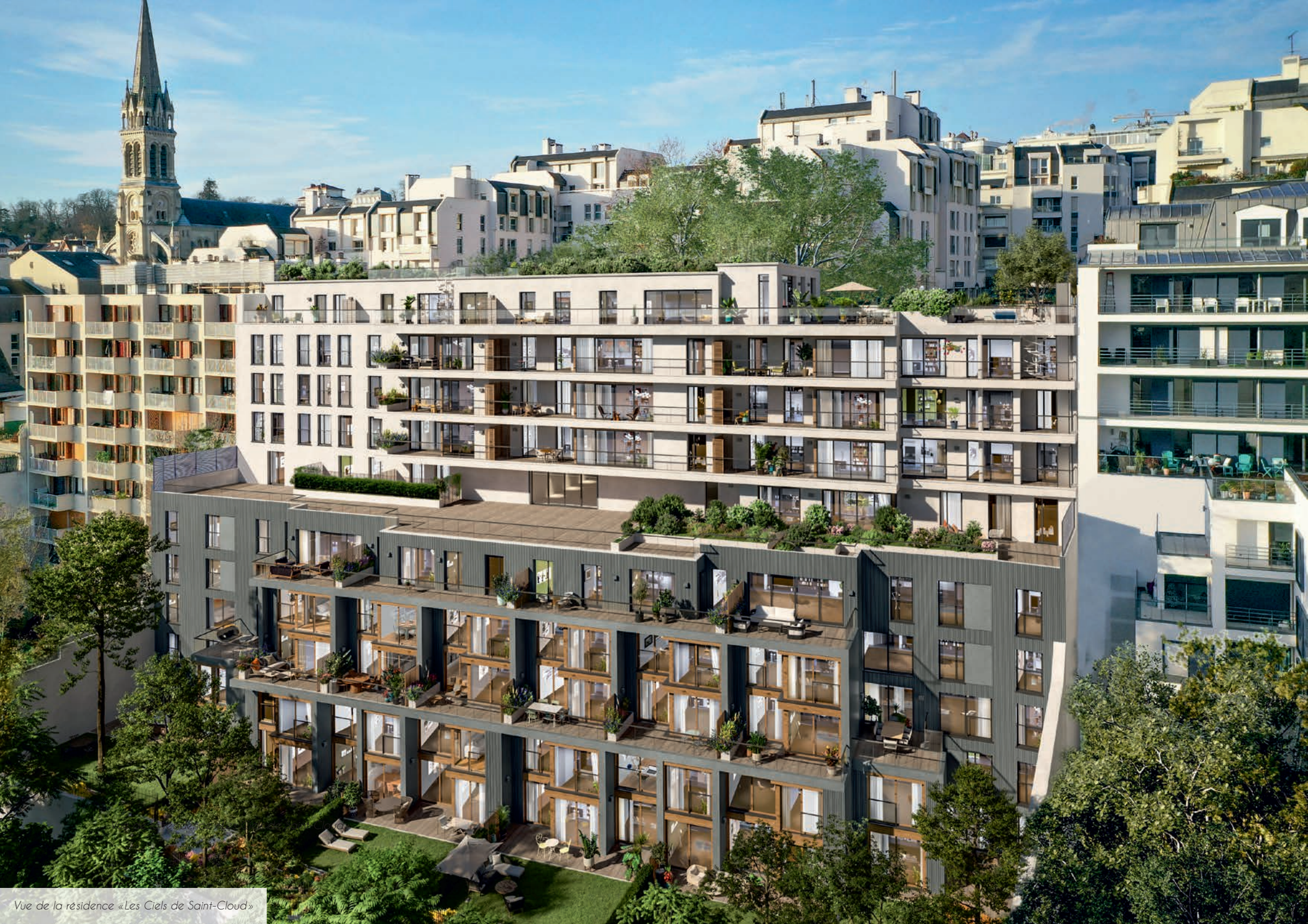
Vue de la résidence «Les Ciel» de Saint-Cloud»