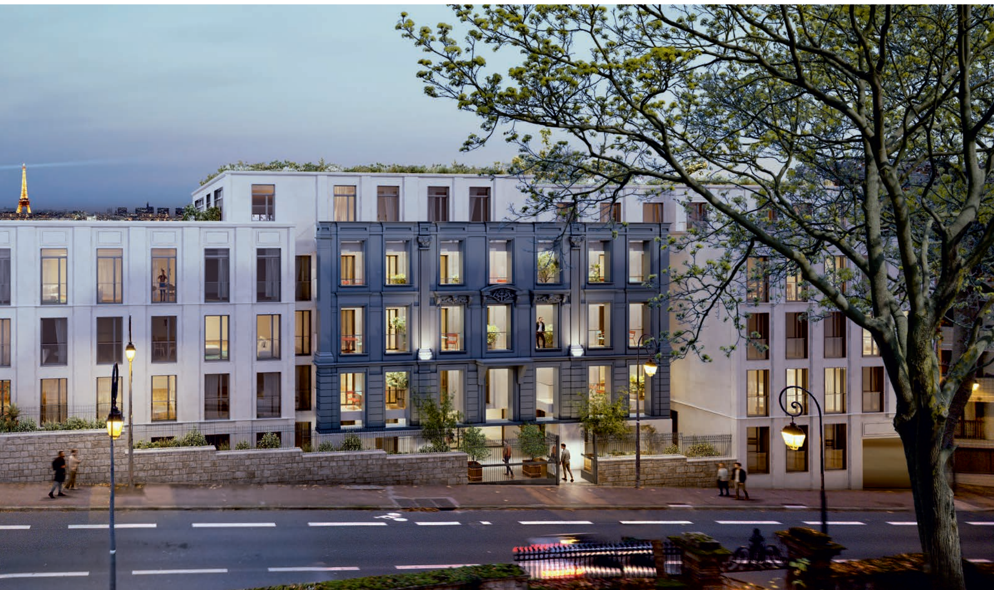
Vue de la résidence «Les Ciel de Saint-Cloud» depuis la rue Dailly