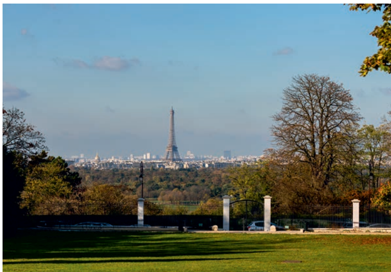
Jardin du Tourneroches