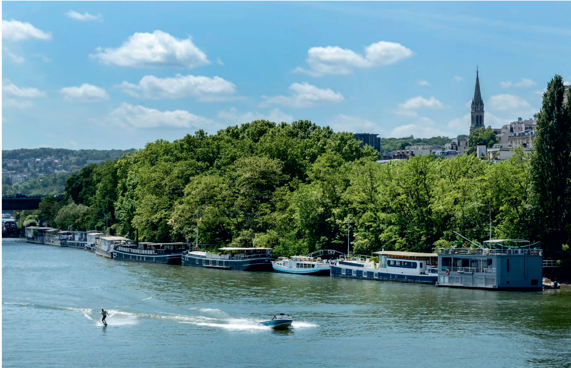
Vue depuis le quai du président Carnot