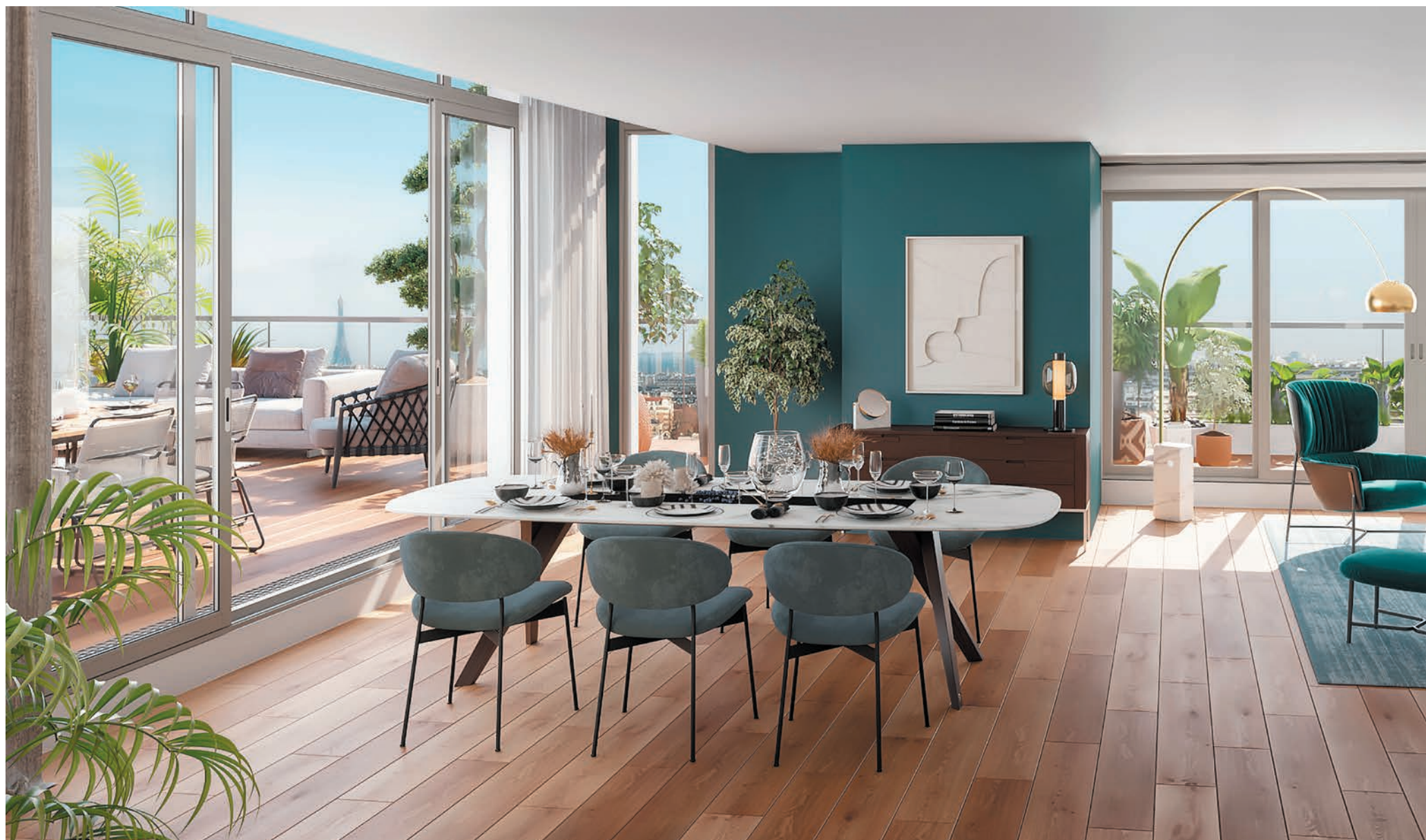
Vue depuis un salon de la résidence «Les Ciel de Saint-Cloud»