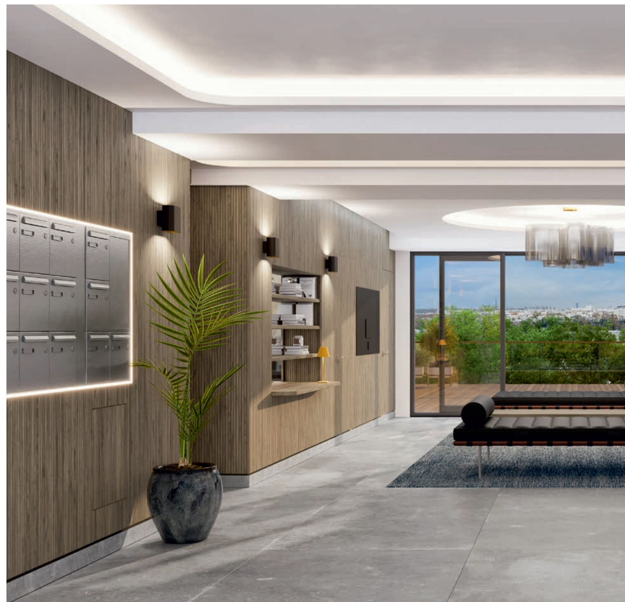
Hall d'entrée décoré de la résidence «Les Ciels de Saint-Cloud» - Vue non contractuelle