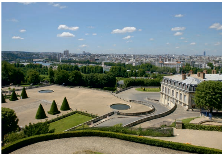
Parc de Saint-Cloud