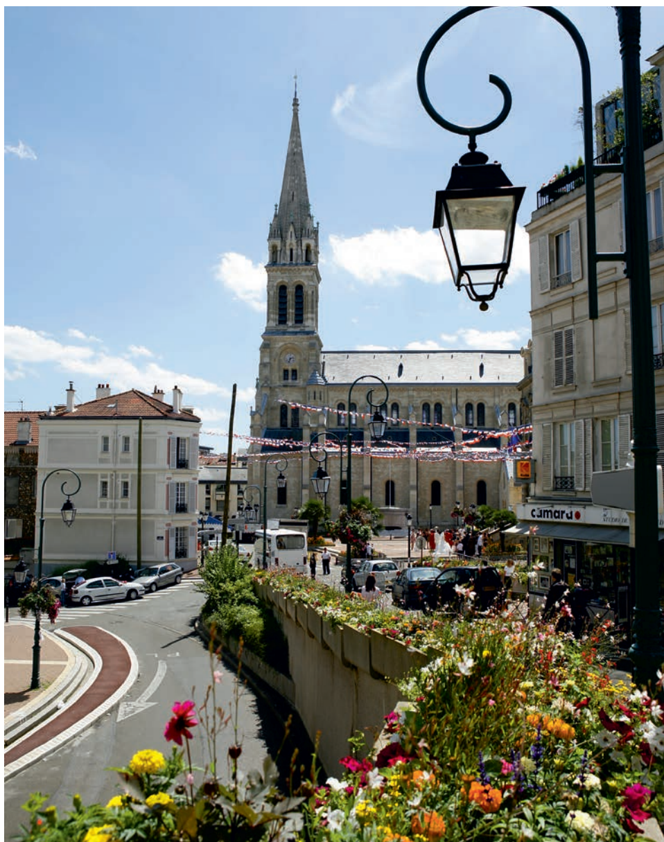
Rue de l'Église