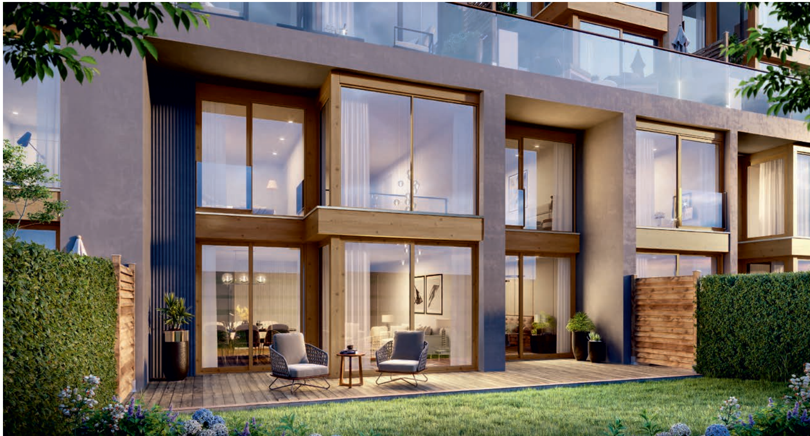
Vue depuis les duplex en rez-de-jardin de la résidence «Les Ciel» de Saint-Cloud»

Dans une communication parfaite avec l'extérieur, ces surfaces familiales aux magnifiques volumes, reproduisent parfaitement l'esprit "maison" si recherché à Saint-Cloud. Un caractère qui se révèle pour chacun à travers le raffinement de leur conception: bureau ou chambre supplémentaire, suites parentales pour plus d'intimité, dressing ou encore buanderie ou cellier, précieux au quotidien.