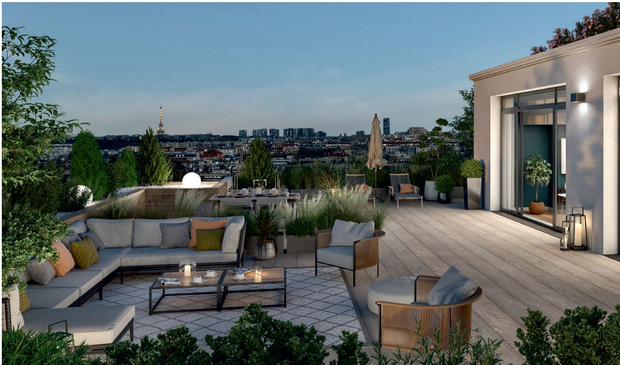
Vue depuis un rooftop de la résidence «Les Ciels de Saint-Cloud»