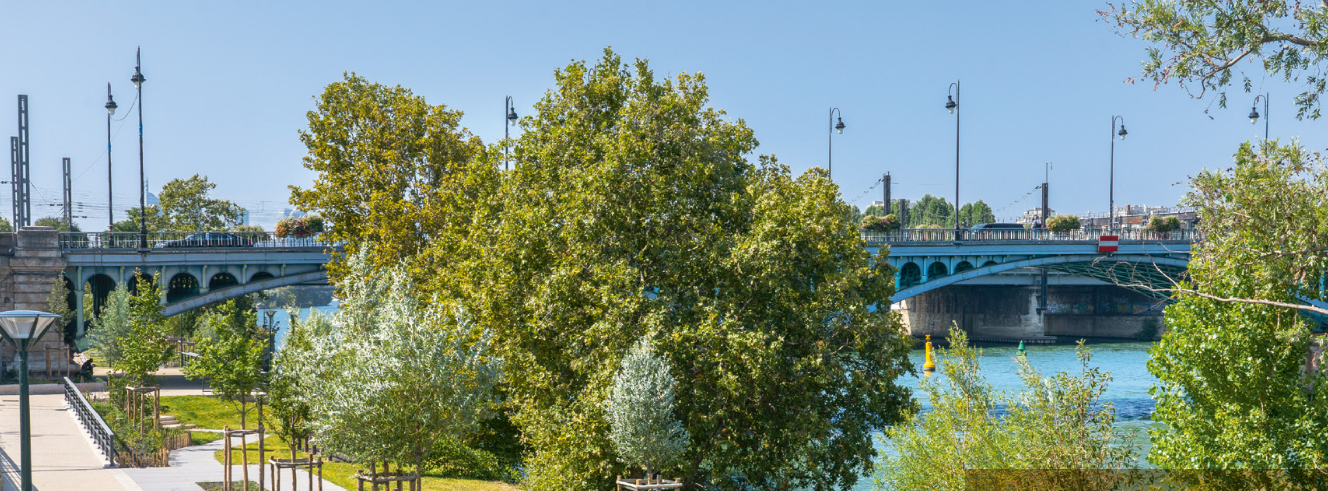
Les quais de Seine à 1 km*