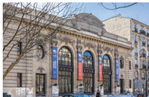
Le théâtre et cinéma Rutebeuf à 550 m*