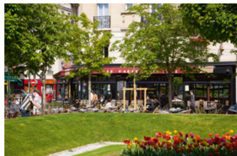
Place des Martyrs à 650 m*

Clichy est avant tout une ville à taille humaine qui a réussi à conserver son âme de village, avec plus de 45 hectares d'espaces verts et des monuments historiques emblématiques comme l'Église Saint-Médard et le Pavillon Vendôme. Pour le plus grand confort de ses usagers quotidiens, la ville intègre également des pistes cyclables, de jolies places piétonnes, de nombreux commerces de proximité, trois marchés de produits frais, des restaurants, des écoles et une offre sportive et culturelle variée : médiathèque, cinéma, théâtre, gymnase, piscine. Tout ce dont vous avez besoin est dans la ville !