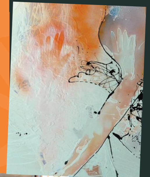
Exemple d'œuvre contemporaine (détail) par Agnès Pezeu