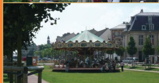
Station RER C / Transilien - Mairie - La Seine - L'Hippodrome - Le Château de Mansart - Centre Ville, commerces de proximité - Les Allées du parc