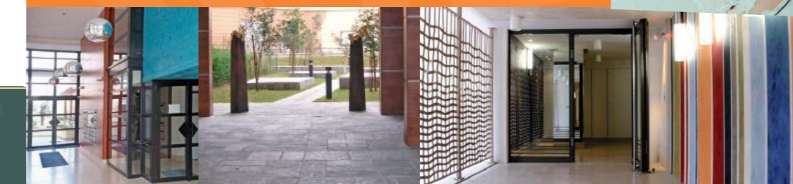
Hall Garden Symphony Châtillon