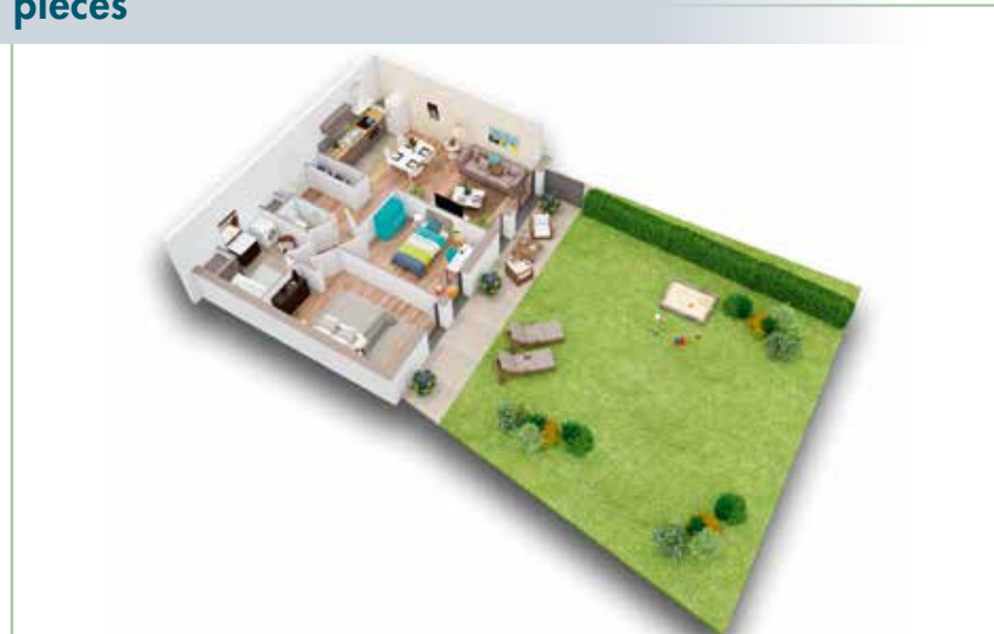
Lot A002 - 61,3 m 2 - Terrasse 14,4 m 2 - Jardin 96,1 m 2