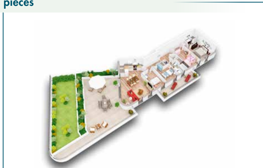
Lot B403 - 92,4 m 2 - Balcon 11 m 2 - Terrasse 69,2 m 2 - Jardin 49,3 m 2