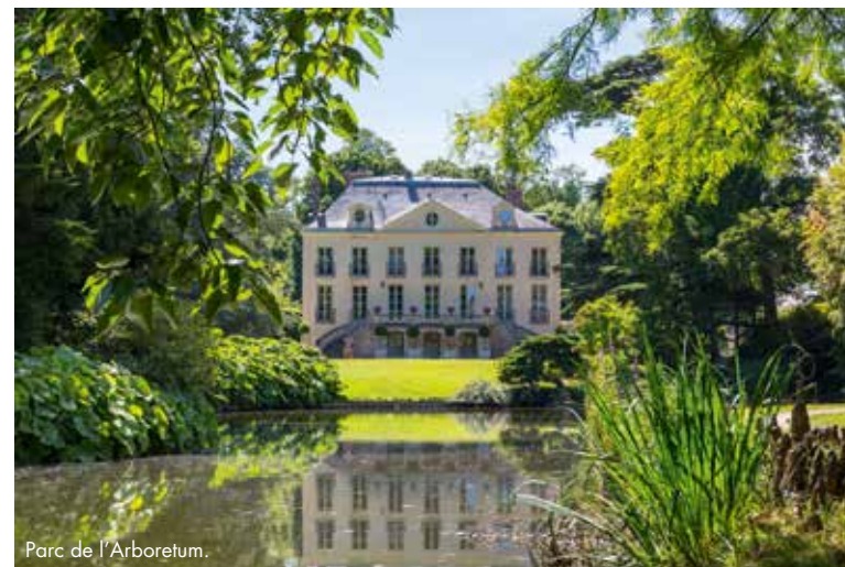
Parc de l'Arboretum.