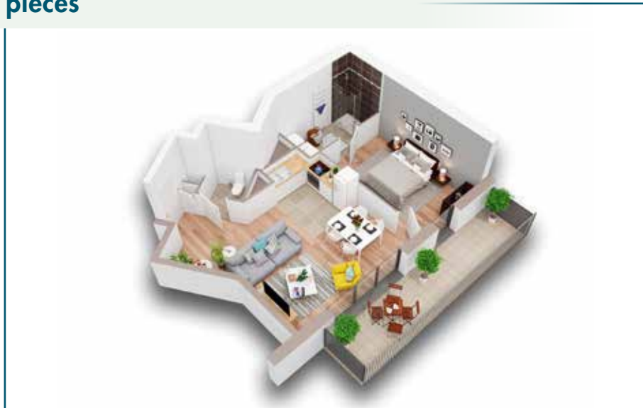
Lot B201 - 45,5 m 2 - Balcon 9 m 2