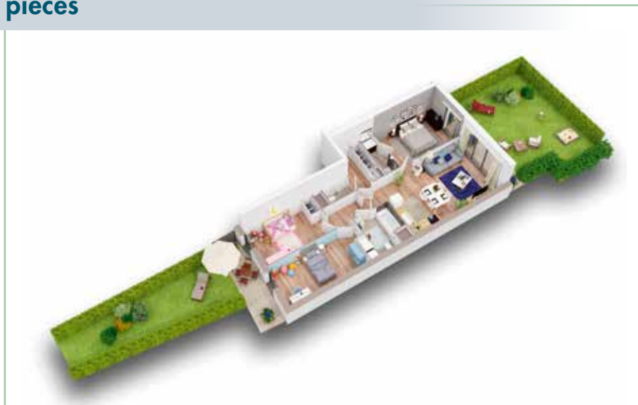
Lot A001 - 80,7 m 2 - Terrasses 17,9 m 2 - Jardins 71,4 m 2