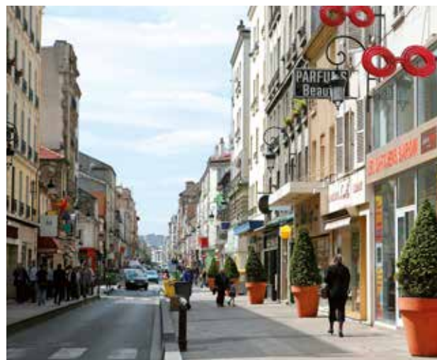
Rue Jean Jaurès