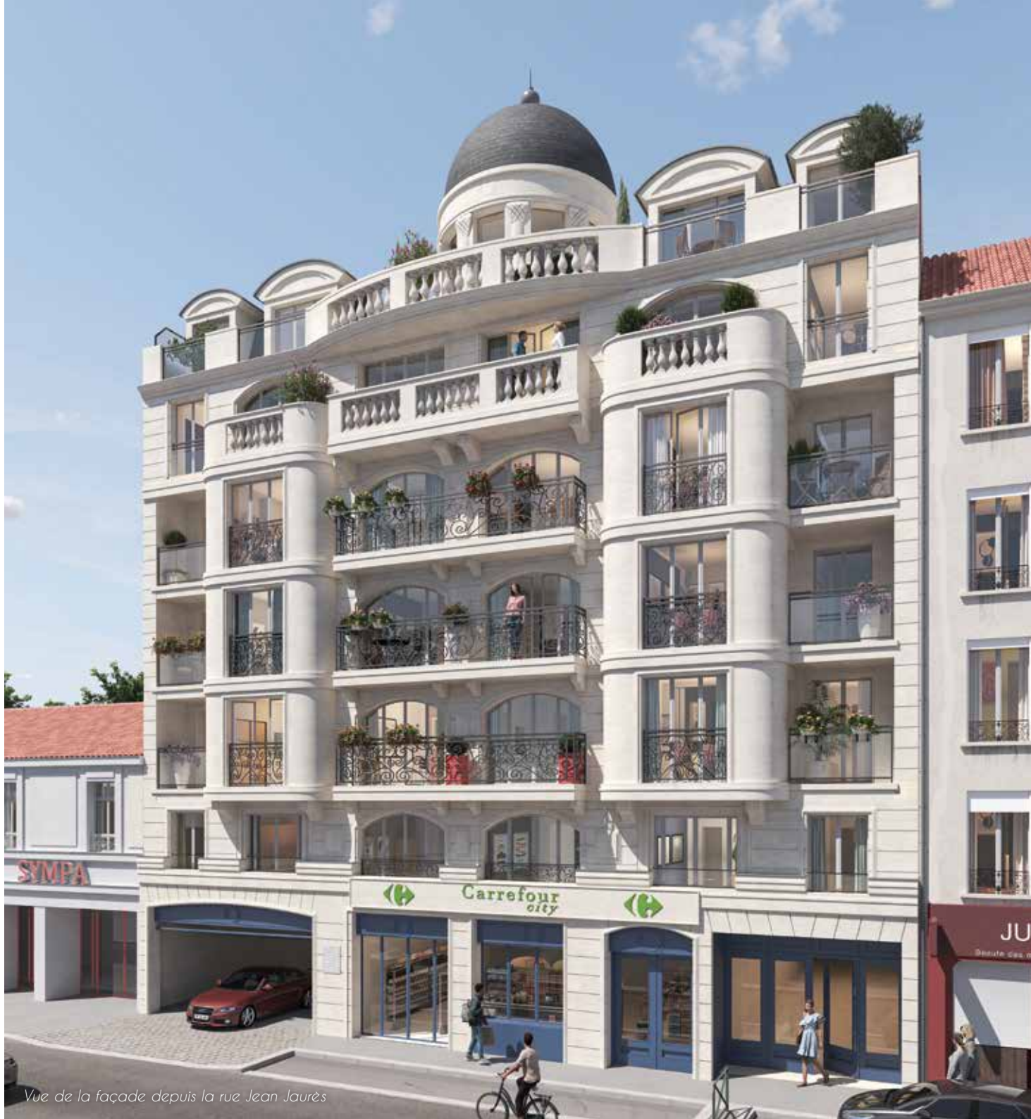
Vue de la façade depuis la rue Jean Jaurès